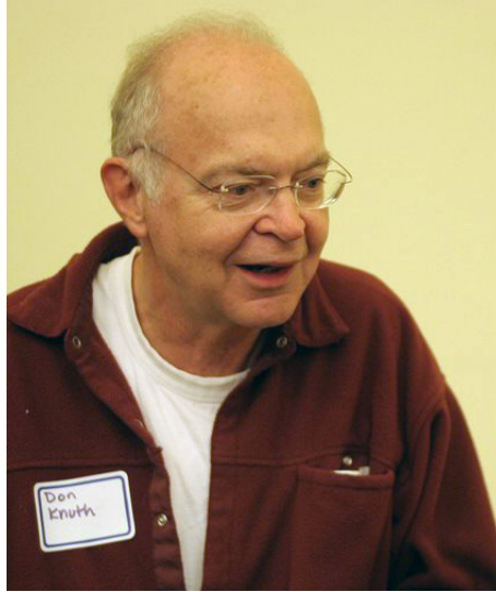
Abbildung 1: Donald Ervin Knuth